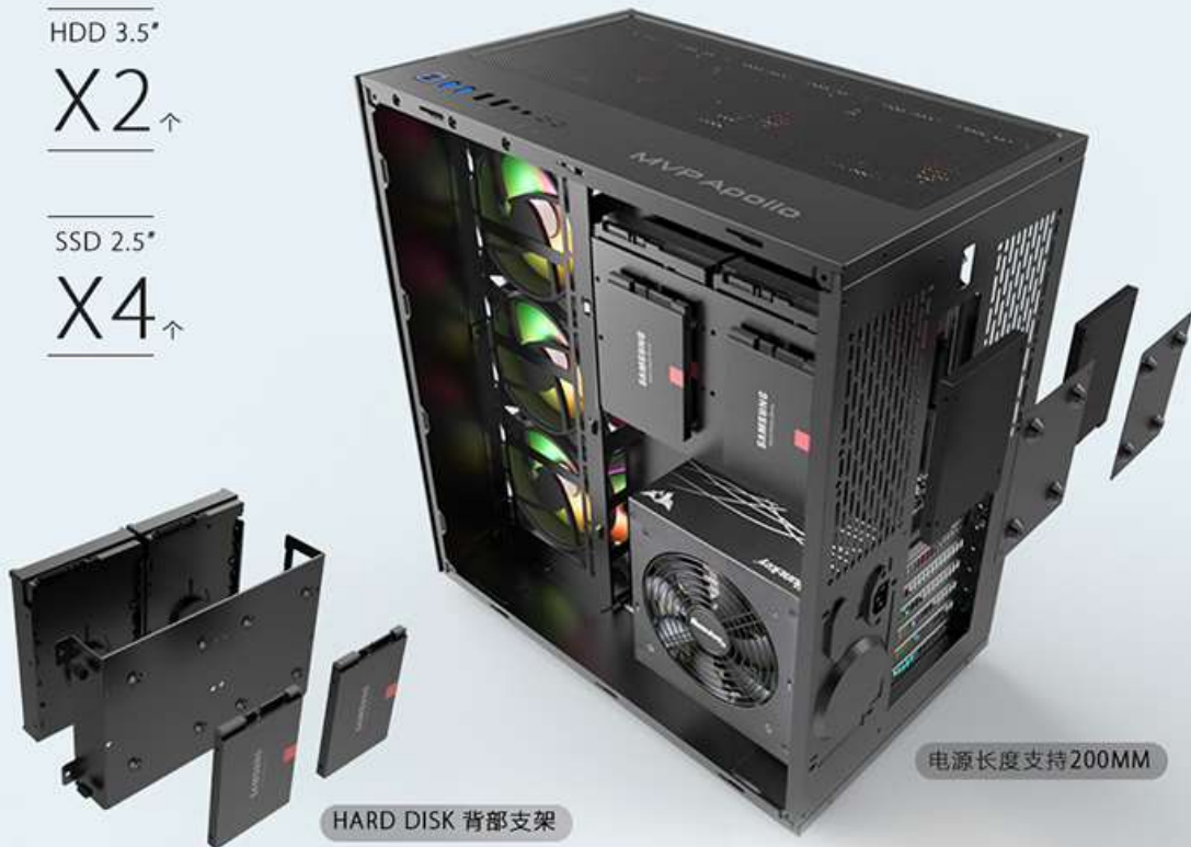
HARD DISK 背部支架